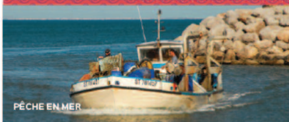
PÊCHE EN MER