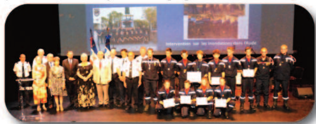
Remise des médailles et des diplômes à une délégation.

Le 5 octobre - Congrès départemental des sapeurs-pompiers à Saint-Mathieu-de-Trévières.