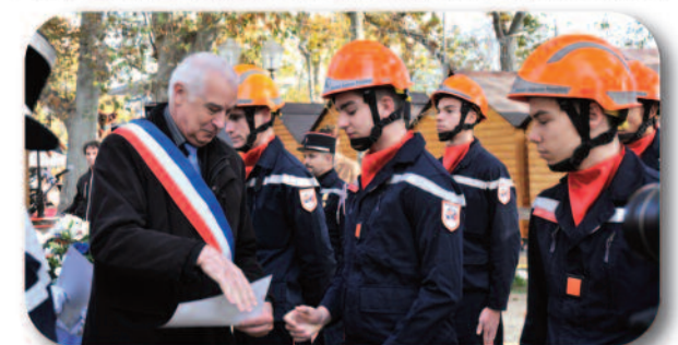
Remise des diplômes à l'ensemble des élèves et formateurs

Le 7 décembre - 56 e anniversaire de la création de l'ordre national du Mérite à Montpellier. (couverture)