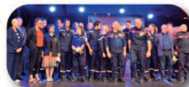
Cérémonie du SDIS 34 à Saint-Martin-de-Londres

- Inciter et encourager la jeunesse à assister à des cérémonies commémoratives en présence des membres de l'ANMONM ; - Mieux se faire connaître en se déplaçant dans les établissements scolaires ; - Participer aux cérémonies des sapeurs-pompiers.