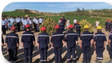
Cérémonie d'hommage à Cazouls-les-Béziers