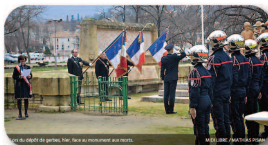
Lodève - 2 janvier 2020