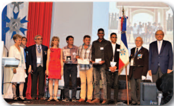
20 juin 2019 à Nîmes - congrès national de l'ANMONM.

Ce dossier présenté au concours du prix national a remporté le 1er prix national de l'Éducation à la citoyenneté remis le 20 juin 2019 à Nîmes lors du congrès national de l'ANMONM.