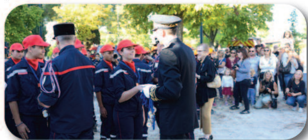
Remise des médailles à l'ensemble des élèves et formateurs

Le 5 octobre - Congrès départemental des sapeurs-pompiers à Saint-Mathieu-de-Trévières.