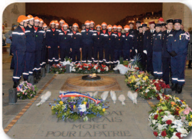
Les lauréats des prix nationaux 2019 se sont retrouvés sous l'Arc de triomphe pour un dépôt de gerbe et le ravivage de la Flamme.