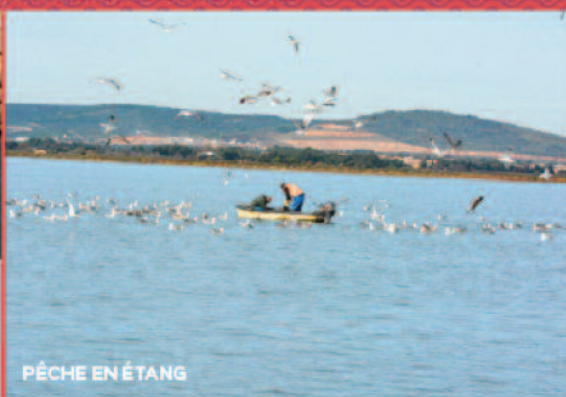
PÊCHE EN ÉTANG