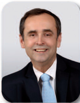
M. Robert Ménard Maire de Béziers.