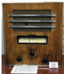
LES "RADIOS" DE LA FRANCE COMBATTANTE