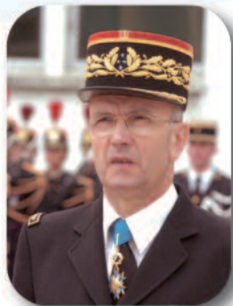
Général de corps d'armée (CR) Michel Alaux ancien inspecteur de la gendarmerie nationale.