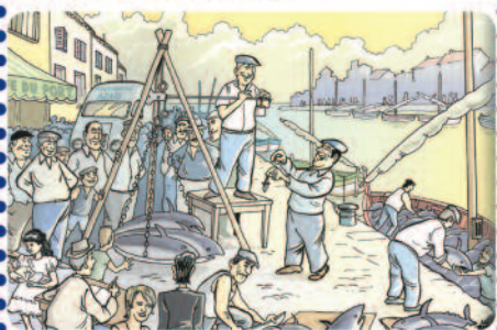
Extrait de l'ouvrage Palavas, la pêche au thon dans les années 50 , d'Albert Edouard, illustration de Régis LESCA.

Lors des passages de thons, les pêcheurs réservaient une partie de leurs captures, qu'ils offraient aux anciens, aux veuves, aux malades et aux handicapés.