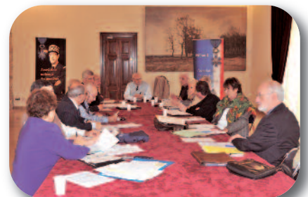
Réunion du comité départemental à Montpellier le 15-11-2010

De plus, nombreux compagnons ont participé aux diverses manifestations des comités locaux voisins.