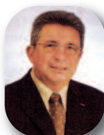
Monsieur Raymond Couderc Sénateur, maire de Béziers