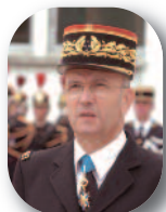
Général de corps d'armée (CR) Michel Alaux Inspecteur de la gendarmerie nationale