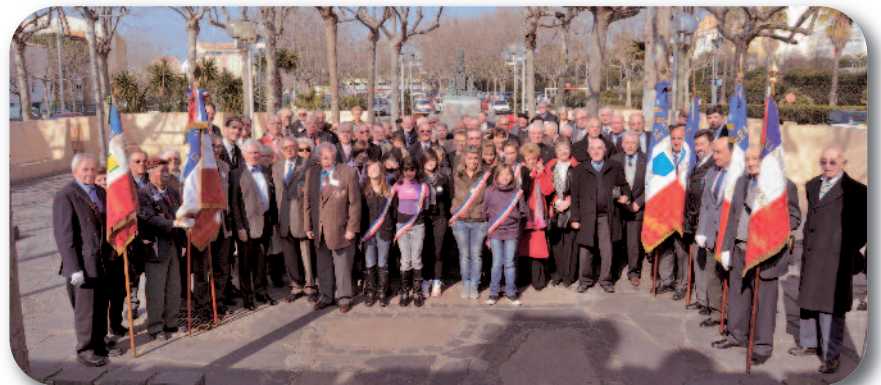
Les participants à l'Assemblée générale avec une délégation du conseil municipal des jeunes de la ville d'Agde.

Merci aussi pour votre confiance et pour votre amitié que vous me témoignez en ma qualité de président de notre Section. Merci aussi à l'ensemble du comité départemental et aux responsables des 7 comités. Tous ensemble nous formons une équipe solide, nous ne voulons pas simplement nous endormir dans le passé mais, tous ensemble, être actifs, à l'écoute des problèmes de notre société en nous engageant, je le répète, pour simplement servir et bien vivre ensemble. Je compte sur vous et vous pouvez compter sur moi.